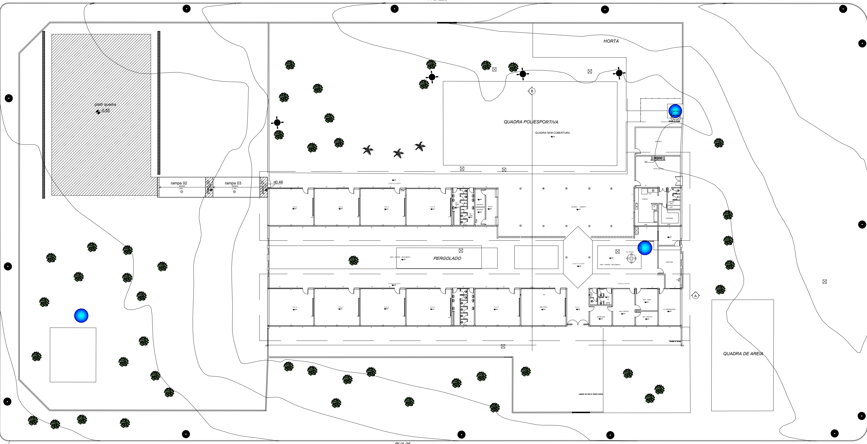
Planta platô Esc.:1/300