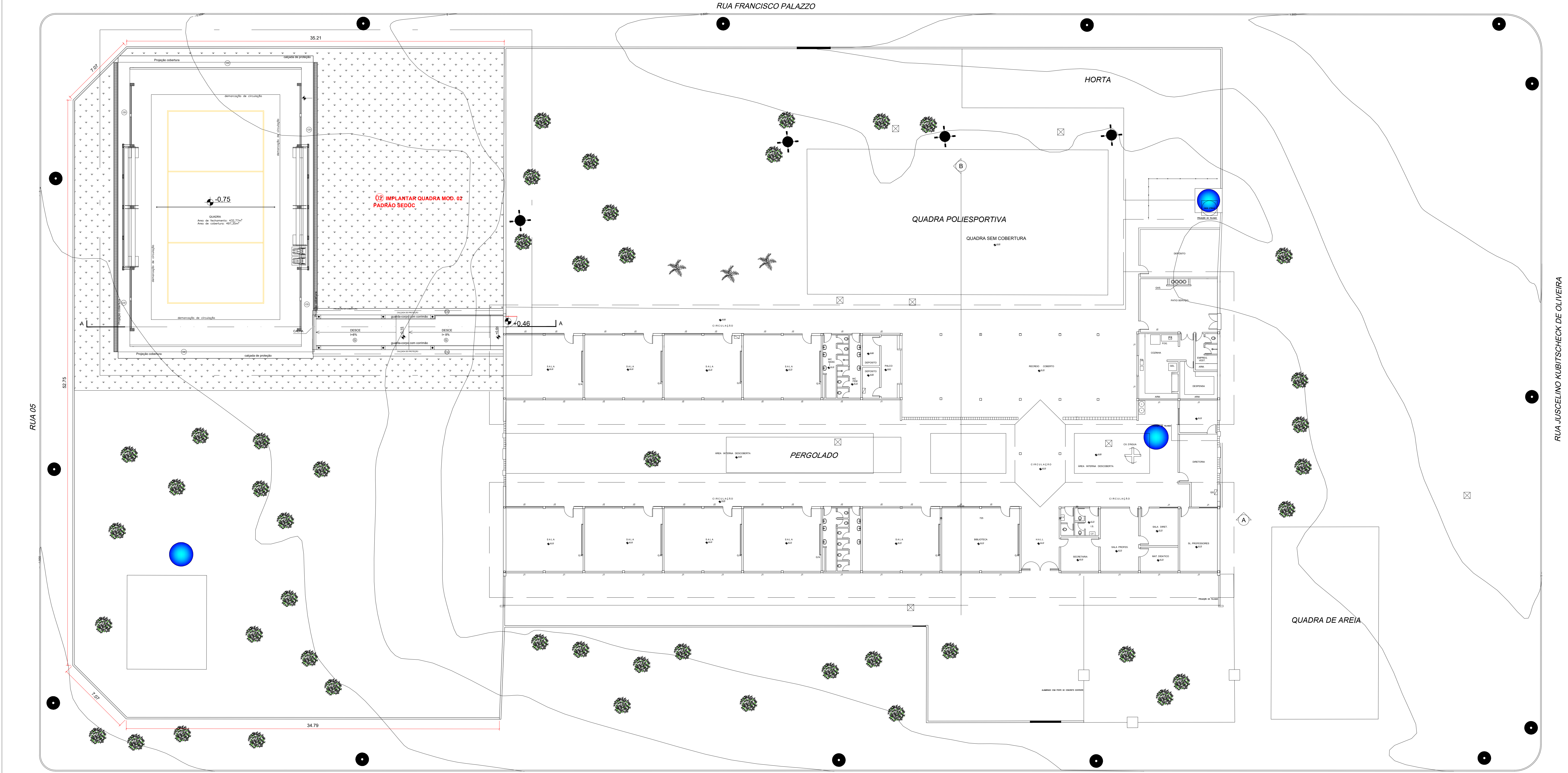
Planta Implantação - FINAL Esc.:1/150